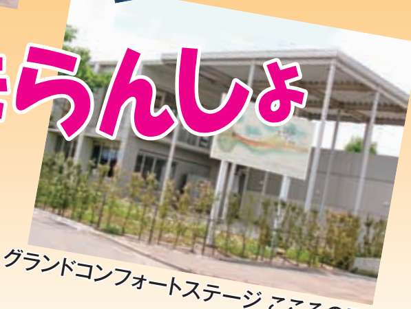
グランドコンフォートステージ ころろの駅