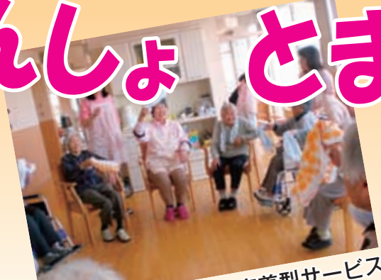
地域密着型サービス