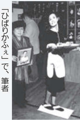
「ひばりかふえ」で、筆者

ッどひばりグッズが並びました。店内は、昔の映画館の切符売り場、のれんに仕切られた厨房(ちゅうぼう)、朝顔型電球のかさの下に自動車ボックシート、壁には映画