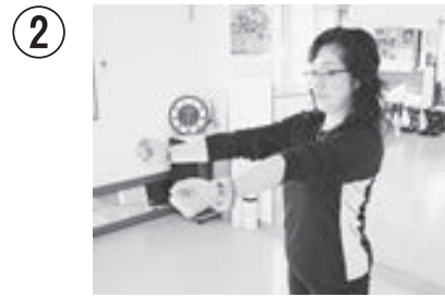
② ひじをまっすぐ後ろに引いて胸を張る。