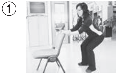
① いすをつかんだスクワット。上体を少し倒し、ひざが出ない。