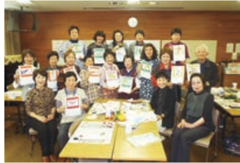
●絵手紙・カレンダー作り●