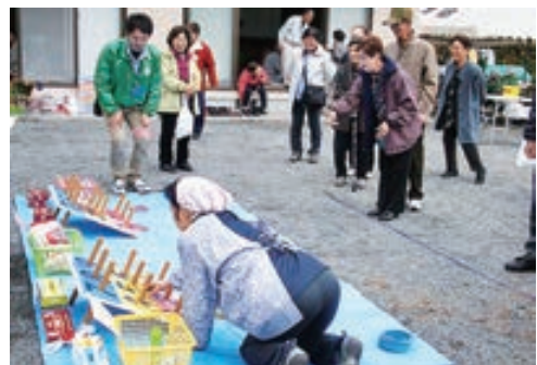
●芋煮会（輪投げ大会）●

秋には、地区民と交流する芋煮会を開催。皆でとん汁に舌鼓。満腹になった後には、輪投げ大会や抽選会も繰り広げられ、大いに盛り上がった。