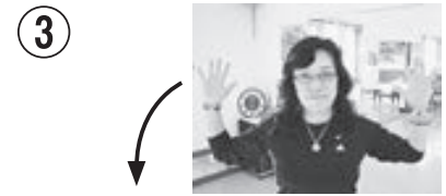
③ 耳の真横に手のひらを置きまっすぐ上下運動をする。