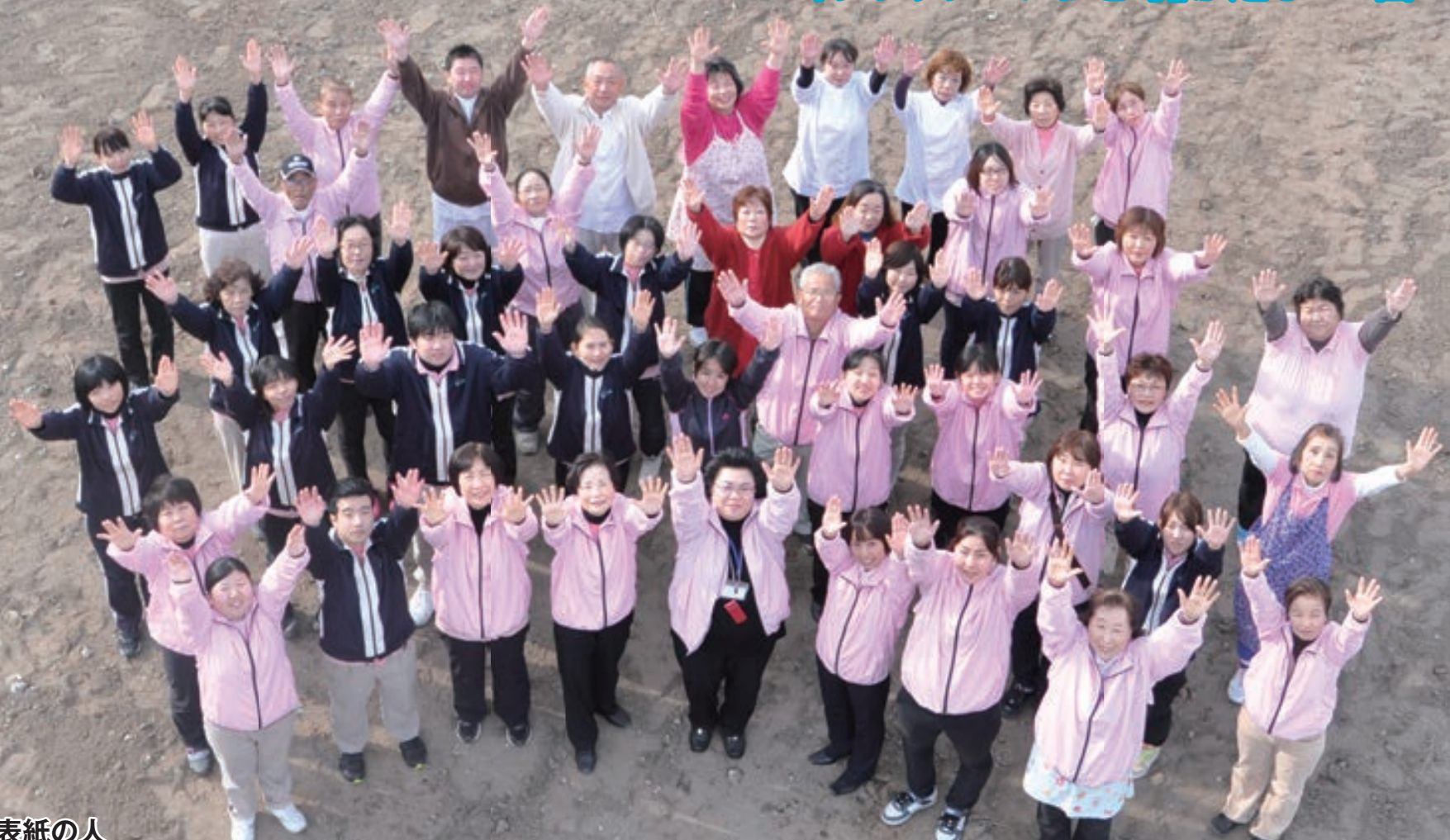
表紙の人 株式会社こころの駅 スタッフの皆さん=記事3面 小名浜字中原 サービス付き高齢者向け住宅「御宿ぶどうや」建設予定地にて

避難生活を続けるお年寄りに 「笑顔と安らぎを」シニア人財倶楽部=5面 「グラッチェいわき号」が走る=4面