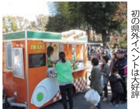
初の県外イベントは大好評

「10代から80代まで、幅広い世代が集まる定時制高校が舞台という」(以上、フジテレビ系)『ハゲタカ』(NHK)などを手がけた脚本家・林宏司氏のオリジナル作品で、コメディ・寄りの作品となる。観る人の共感を得られるという。生徒と同じ目線に立つ