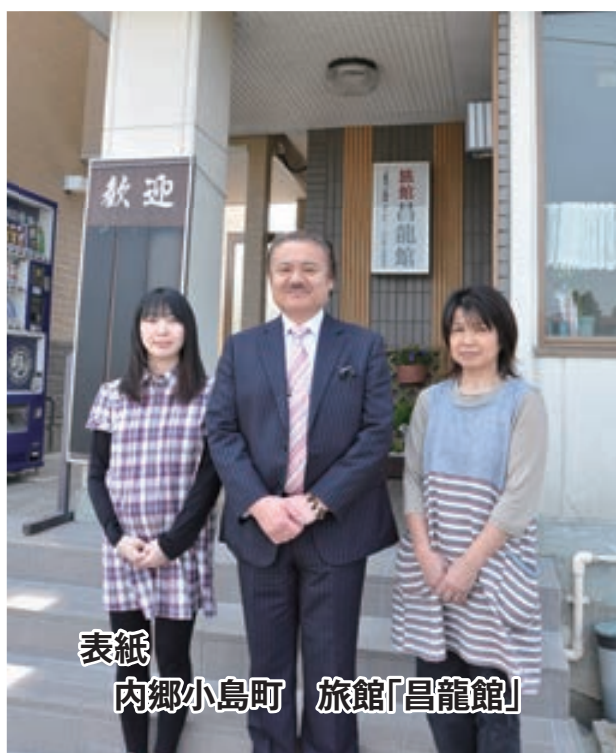
表紙 内郷小島町 旅館「昌龍館」