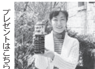
プレゼントは「ちらり」