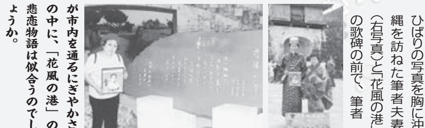
美空ひばりファミリークラブ=ひばりプロダクション主催の美空ひばりのファンクラブ。