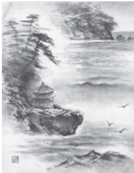
式拾式 五浦六角堂