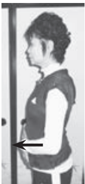
吐いてお腹を小さく縮める