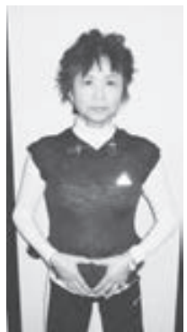
腹式呼吸 へその真ん中を意識して息を吸いながらお腹を大きく膨らませる