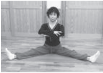
(写真5) 脚のバリエーション