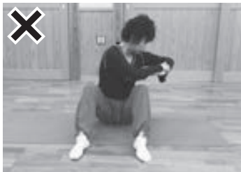
(写真3) 軸の回転というよりも腕が先行し、首も前傾している