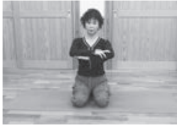
(写真6) 脚のバリエーション

シニア世代のための 役立つSNS講座 ③ ツイッターに先月、設定方法は、投稿画面新たに「投票機能」がの下部に新たに表示追加されました。自ら「円」を入力した任意の質問に「ラフ」と投 2つの回答を設け、い票のボタ ずれかに投稿してもらをクリッ うことができます。投クすると、 稿から投票できるまで 質問と回答 24時間という期限が自を入力でき 動設定されます。投ます。スマ 票には誰でも参加でートフォン き、どちらの回答をのの場合、 んだかは公開されませ AndroidとIOSの公式 ん。パソコンの場合の ツイッターアプリでそ