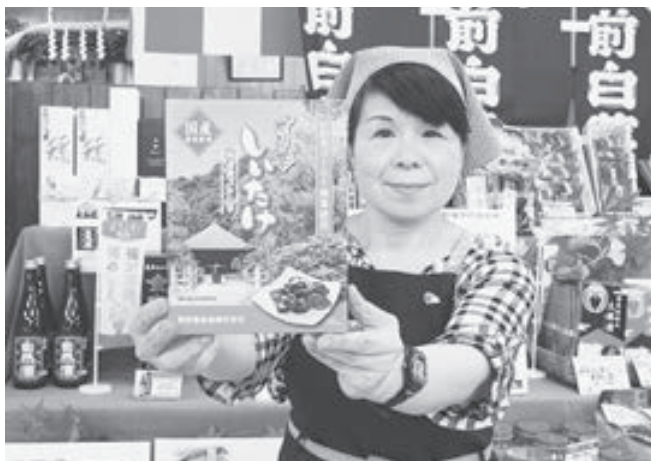
プレゼントはこちら