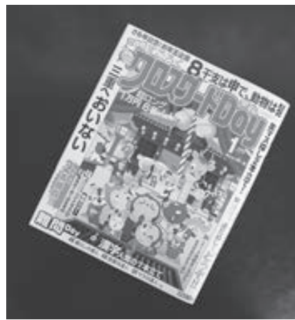
プレゼントはこちら(雑誌の写真は現在発行中のものです)