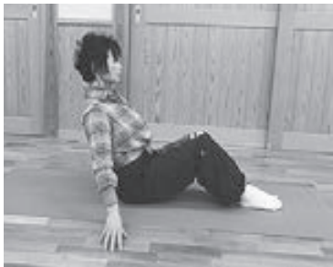
(写真2) 背骨を真っすぐのまま重心 を後ろへ移動