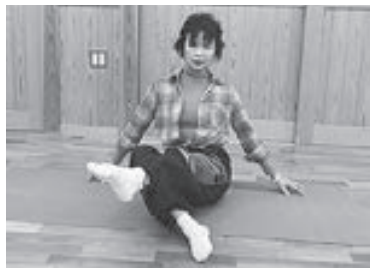
(写真4) 両肩は左右対称のまま脚は ひざも伸ばす