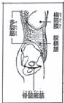
ピラティスのターゲット インナーマッスルの部位。このほか、 内腹斜筋・腸腰筋なども対象になり ます。

Twitterはこちらです！ http://twitter.com/iwakicity Facebookはこちらです！ http://www.facebook.com/iwakisomeken ホームページはこちらです！ http://hisanosystem.com/