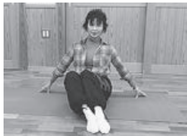
(写真3) お尻は浮かせない