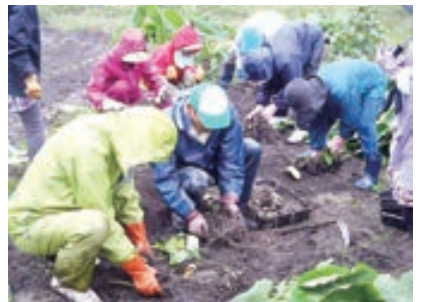
土起こしから収穫まで皆で頑張りました