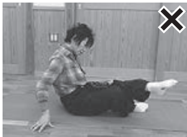
(写真5) 骨盤が後傾し、腹部が落ち てしまい上半身を片腕で支えている