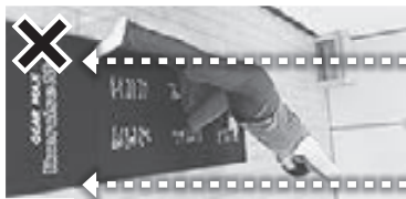
(写真6) 上体が傾いた結果、30度の壁が50度になっている。軸足の膝が前に出ていて負担が大(誤)