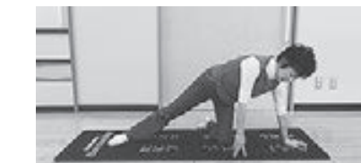
(写真1) セットアップ(準備)