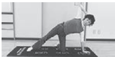
(写真2) 軸足の膝は骨盤の真下。手は肩の真下