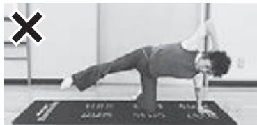
(写真5) 上体が前に傾いている(誤)