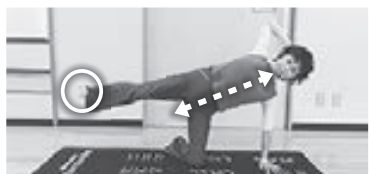
(写真3) 脚の高さは最大で腰の高さまで。足指の前にそれ、アキレスを伸ばす。臀筋大腿筋が発揮され、股関節をサポートできる