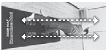
(写真4) 横上から見た図。30度の前後の壁内でのイメージ