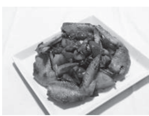
レモンで爽やかに！

に野菜をのせ、その上手に手羽先を添える。 ◆材料(2人分) 手羽先6本、ニンジン、玉ネギ各80g、ジャガ芋100g、ピーマン2個、パプリカの赤と黄各30g、ブロッコリー60g、マイタケ、うゆ、塩、コシユウ各少量。 調味料AⅠレモン果汁大さじ2、塩小さじ1、コシユウ少量。調味料BⅡ黒酢大さじ2、酢大さじ1、砂糖大さじ2、ごま油小さじ2分の1、しょうゆ、塩、コシユウ各少量。