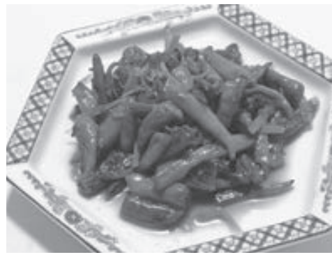
ショウガが味の決め手

がき、長ネギの粗みじん、赤唐辛子の輪切りなどを少量加えたり、ナスやピーマンを足してもいい。 また、厚手のフライパンを使うと中火でも、やや弱火でも効率がよく、蒸発量も多いので適している。 ◆材料（2人分） シントウ30本、乾燥アサリ20粒、豚肉の赤身40g、ニンジン20g、ショウガ5g、みりん、砂糖、しょうゆ各大さじ2、酒小さじ2、削り節5g、だし大さじ4、炒め油大さじ1、ごま油小さじ1。