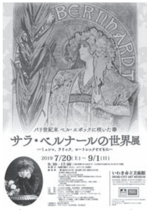
プレゼントはこちら

今回のクイズはクロスワードパズルです。お楽しみください。正解者の中からペア10組に、いわき市立美術館様提供の「サラ・ベルナルの世界展」チケット(9月1日) チケットをプレゼントします。