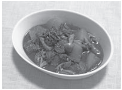
しっかりと煮詰める

みのもろもろで使えま す。また、長ネギ、小 口切りの唐辛子、粒ざ んしょうを加えてもい いでしょう。 ◆材料(2人分) 牛もも肉160g、 大根4分の1本、シメ ジ4分の1パック、ホ ウレン草1株、酒大き じ2、しょうゆ大きじ 1、中華味調味料(か りゅう、またはガラ スープのもと)、砂糖 各小さじ1、水100 cc、塩、コショウ各少 量、炒め油大さじ2、 ごま油少量。