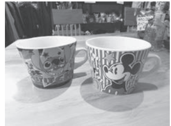
プレゼントはこちら

今月のクイズはクロスワードパズルです。そして、正解者の中から7人に、おしゃなファッションの店「メルヘン屋」(いわき市小名浜) 提供のディズニーキャラクターのミッキーマウスカステイチが描かれたテーママグカップ1個をプレゼントします。どちらのキャラクターのマグカップがお手元に届くかはお楽しみに。