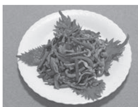
オイスターソースで

③を盛り付ける。材料(2人分) 豚肩ロース薄切り肉160g、ニンニクの芽100g、ニンジン30g、パプリカ赤、黄2、砂糖、塩、コショウ各少量。水溶き片栗粉(片栗粉小さじ2、水大さじ1)。