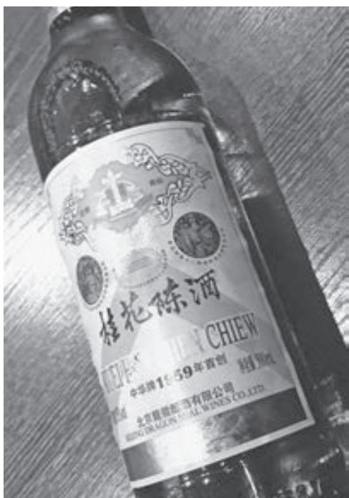
金木犀の香りにはリラックス効果あり。適度な飲酒で安眠を。