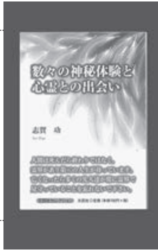
プレゼントはこちら

本書は著者の霊的体験を基に、なぜ人間はこの世に生まれ、悲しみや苦しみを経験するのかを考えながら、読者に心の癒しと安らぎを与える1冊です。希望者は、はがきを①クイズの答え②好きな食べ物とその理由③郵便エピソードなど④郵便送し。賞品はいわき民報社本社(いわき市平字田町)で引き換えとなります。