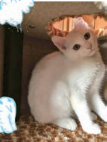
シャルル 3歳♀ 「オフショット」 もちゃん・37歳・いわき市錦町