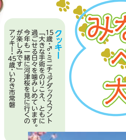
フッキー 15歳・♀・ミニチュアダックスフント 「大きき手術をのりえとこに過ごせ白々を噛みしめています。今年も一緒に河津桜を見に行くのが楽しみです」 アッキー・45歳・いわき市常盤