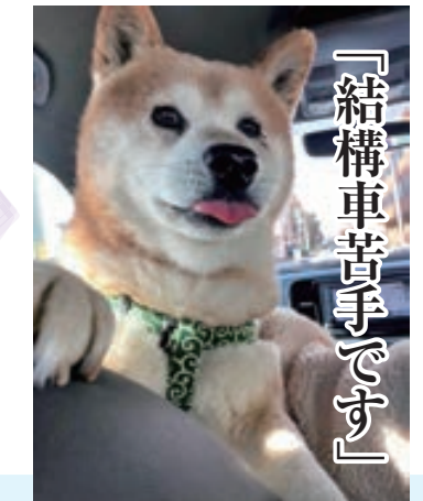
タンク 14歳・♂・柴犬 たなほん・18歳・いわき市平