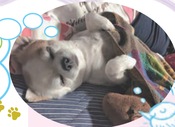
ももちゃん 9歳11カ月・♀・チワワ「ねむねむタイム」 もふもふ・35歳・いわき市山田町