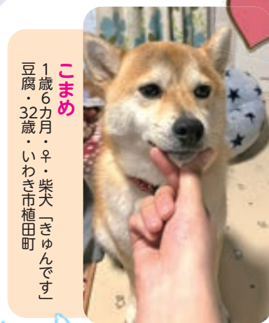
こまめ 1歳6カ月・♀・柴犬「ぎゅんです」 豆腐・32歳・いわき市樋田町