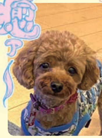
マフィン 5歳5カ月・♀・トイプードル 「癒されます」 カプチーノ・38歳・いわき市錦町