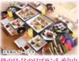
母の日・父の日プランも承り中