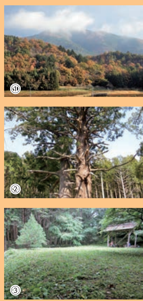
1 往生山 2 八坂神社の二本杉 3 上遠野城跡(八潮見城・八塩城) 4 龍神峡 5 滝富士

遠野町は、いわき市の南西部にあり、阿武隈高地の南部に位置します。中山間地域ならではの自然豊かな土地です。