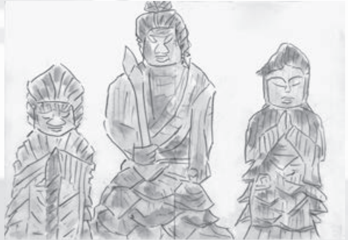
不動明王と二童子立像