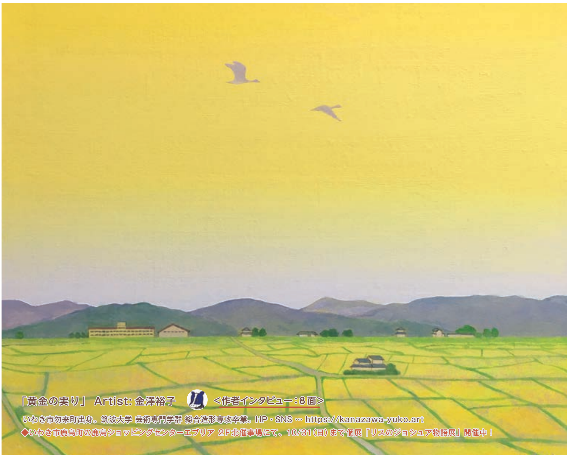
「黄金の実り」 Artist: 金澤裕子 <作者インタビュー:8面>

いわき市勿来町出身。筑波大学 芸術専門学群 総合造形専攻卒業。HP・SNS --- https://kanazawa-yuko.art