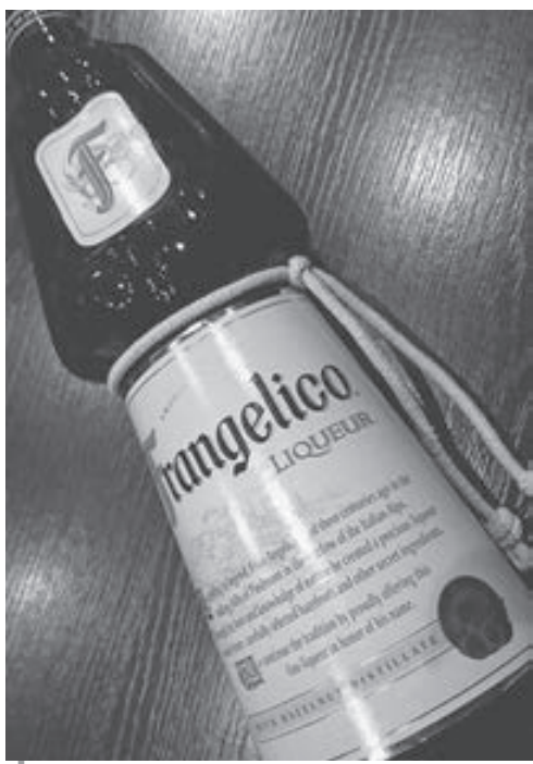
長く平たい独特のボトル。イタリアのお酒は他もみんなオシャレ。

いカラメル色。トロリとしたテクスチャー。甘く香ばしいナッツの風味。度数は20%。ストレートをチビチビ飲むのが好きという声もありませんが、私のおすすめはミルク割り。すると、あら不思議。懐かしの栗もなかアイスの味がするんです。子供の頃に食べたあの味! 疲れて帰った夜に、ほっとできる一杯が簡単に作れますよ。他にはコーヒールに入れる等のアレンジも。自宅に一本あれば重宝するリキュールです。疲れも、秋に感じる淋しささえも、「フランジェリコ」で満たしてみませんか。