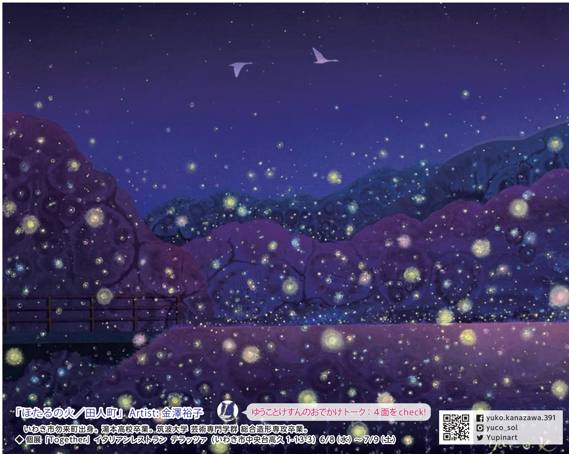
「ほたるの火/田人町」Artist: 金澤裕子