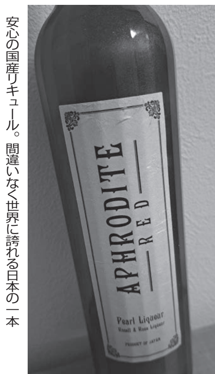
安心の国産リキュール。間違いない世界に誇れる日本の一本