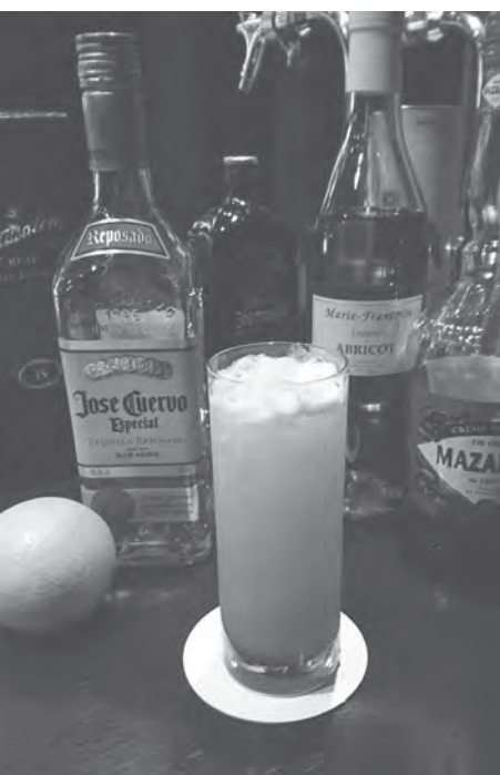
朝焼け色のテキーラ・サンライズは飲み口もたまらない一杯

ジュースを朝焼け、グレナデンの赤を太陽に見立てた美しいカクテルです。テキーラの香ばしさがオレンジジュースと相まって、そこへグレナデンの甘み加わり、たまらない飲み口よさに。このカクテルを飲むと、私の中に浮かぶ言葉があります。それは『日はまた昇る』。ヘミングウェイの名作ですが、作品を読んだかたはご存知の通り、希望を込めた