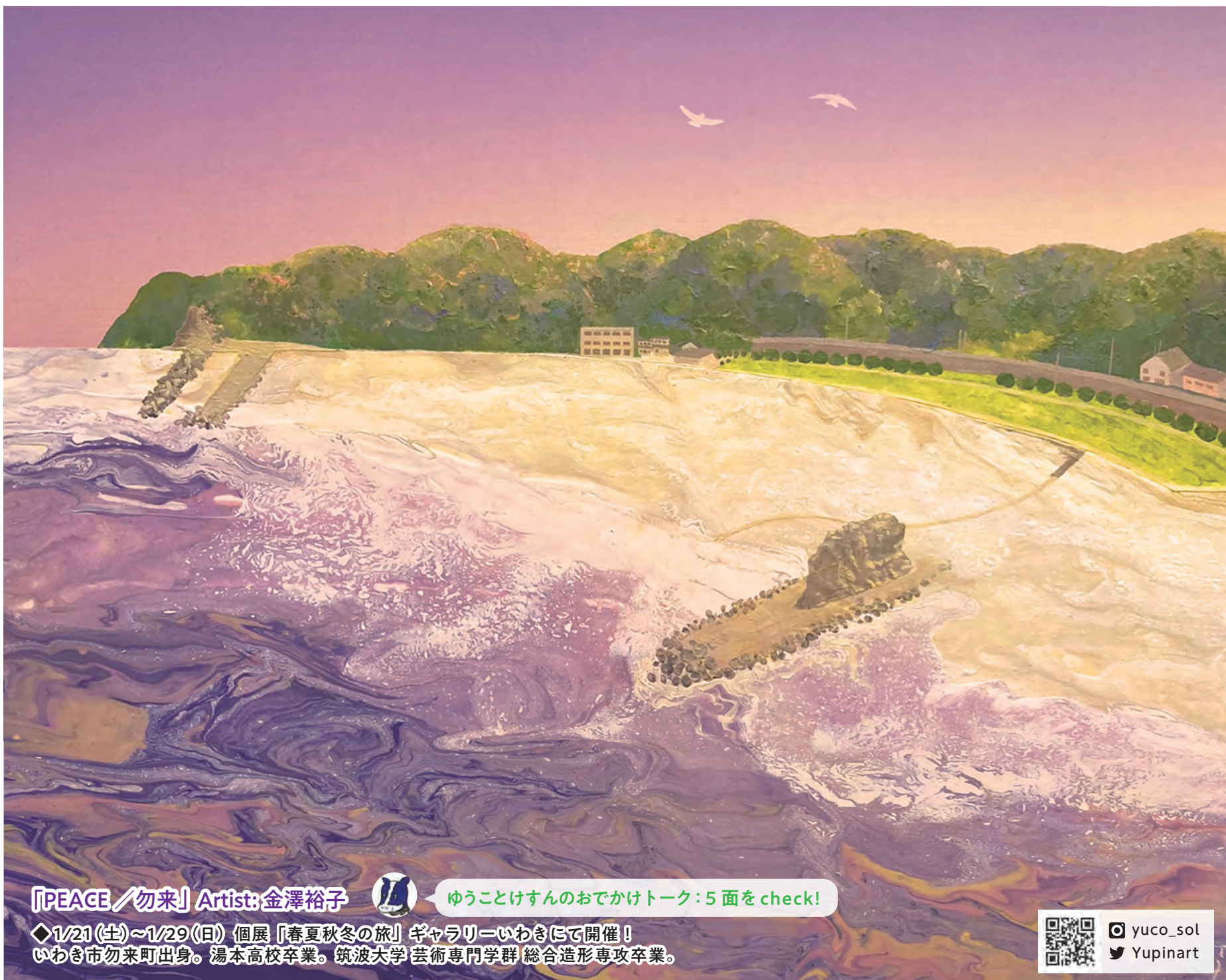
「PEACE/勿来」Artist: 金澤裕子 ゆうこことけすんのおでかけトーク: 5面をcheck! ◆1/21(土)~1/29(日) 個展「春夏秋冬の旅」ギャラリーいわきにて開催! いわき市勿来町出身。湯本高校卒業。筑波大学芸術専門学群総合造形専攻卒業。