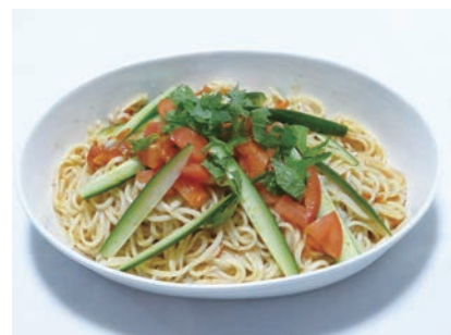
冷たいカレーうどんで さっぱりしましょう

①ゆでたうどんを冷水で締めてカレーつけゆであえ、トマトとキュウリを添えた食欲をそそる一品写真。②2人分の材料は、細うどん（乾麺）300g（蒸し麺なら2玉）、トマト1個（ミニトマトなら6個）、キュウリ2分の1本、大葉、三つ葉各適量、市販の麺つゆ大さじ1〜2、カレー粉大さじ1。だし=花かつお20g、煮干し粉10g、焼きあご（トビウオの焼き干し）粉10g。③細うどんは表示通りの時間でゆで、流水で手もみ洗いして水を切る。トマトは水洗いし、へたを取ってさいの目に切る（汁も捨てず使う）。キュウリは水で洗った後、縦の四つ割りにし、斜め薄切りにする。大葉は千切りにし、水にさらし