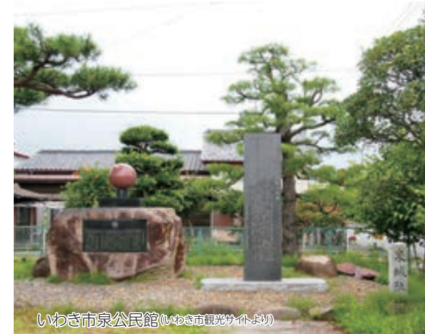
いわき市泉公民館(いわき市泉町1-15)

いわき市泉公民館の敷地は「泉城跡」です。泉藩は1634年、磐城平藩・内藤家から、内藤政晴(1626-1645)が分かれて立藩しました。幕末まで内藤、板倉、本多家が治め、特に本多家2代の本多忠壽(1740-1813)は、江戸中期の寛政の改革に関与し、「寛政の三忠臣」と呼ばれました。忠壽は参勤交代の際、太陽を表す赤玉「朱天目」を飾った槍を掲げることが許され、それを模して功績をたたえる石碑も城址には建っています。