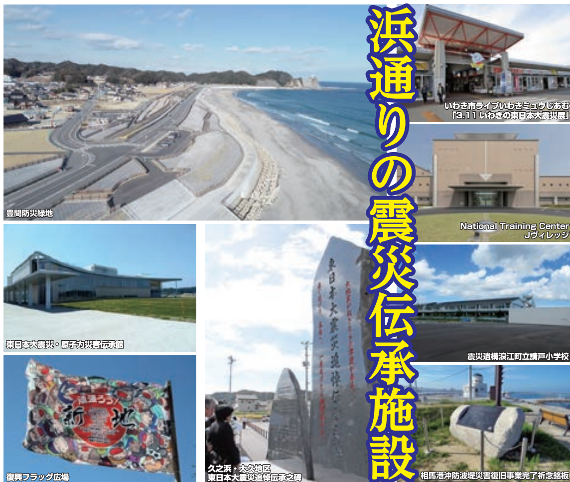
出典：「震災伝承施設一覧」（震災伝承ネットワーク協議会事務局（国土交通省東北地方整備局企画部）（https://www.thr.mlit.go.jp/shinsaidensho/facility/index.html）を加工して作成

3月11日で東日本大震災から11年を迎えます。国土交通省東北地方整備局などで行く「震災伝承ネットワーク協議会」では、東日本大震災から得られた実情と教訓を伝承する施設を登録しています。来訪の利便性や案内役の有無に合わせ、3つの分類に分かれており、浜通りには以下の施設があります。