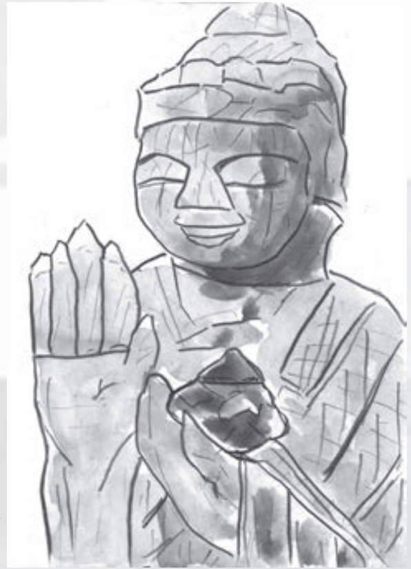
いがったあ逢えた逢えたよ