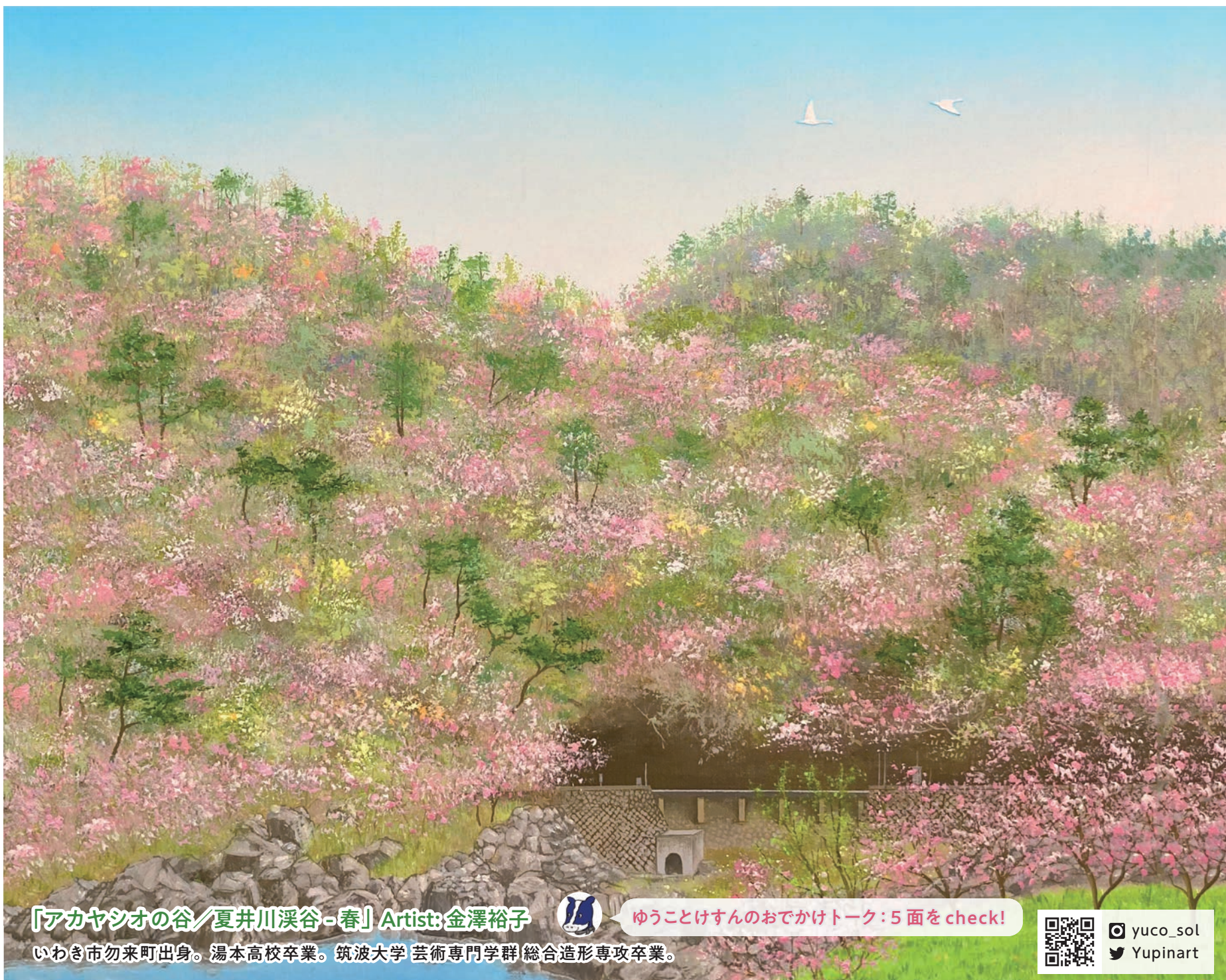
「アカヤシオの谷/夏井川溪谷-春」Artist:金澤裕子