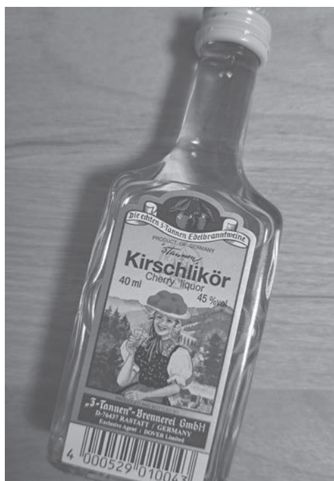
厳選された完熟チェリーを使用。ドイツの老舗タンネン社の一本。

サクランボが大好きです。今年 は春先からの気温が高かったた め、福島県のサクランボは収穫時 期が例年よりやや早いのだとか。今 回は、今まさに旬のサクランボの 蒸留酒「キルシュヴァッサー」を 紹介します。 キルシュヴァッサーは、サクラ ンボを種ごと潰して発酵させ、6 週間前後寝かせた後に蒸留して造 られます。ドイツ南部、オースト リア、スイスが主な原産国です。 「キルシュ」はサクランボ。「ヴァッ サー」は水を意味します。アルコール 度数が高い蒸留酒なのに、なぜ、 水を意味する言葉が使われるのか というところ、見た目が水のように無 色透明だからなのだとか。カタカ ナの表記上、キルシュヴァッサーと 呼ばれることも。また、日本では 単にキルシュと呼ぶことが一般的