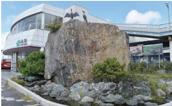
南口広場には、泉町下川の「照島」の自然石のモニュメントが設置されている。毎年11月ごろにはウミウが越冬のため飛来することでも知られており、2羽のウミウがたたずむ様子が忠実に再現されている。

泉町は、広いエリアにわたって、飲食店や医療機関、福祉施設、ギャラリーなど、さまざまな施設がそろっています。魅力あふれる泉町にぜひ足を運んでみませんか？