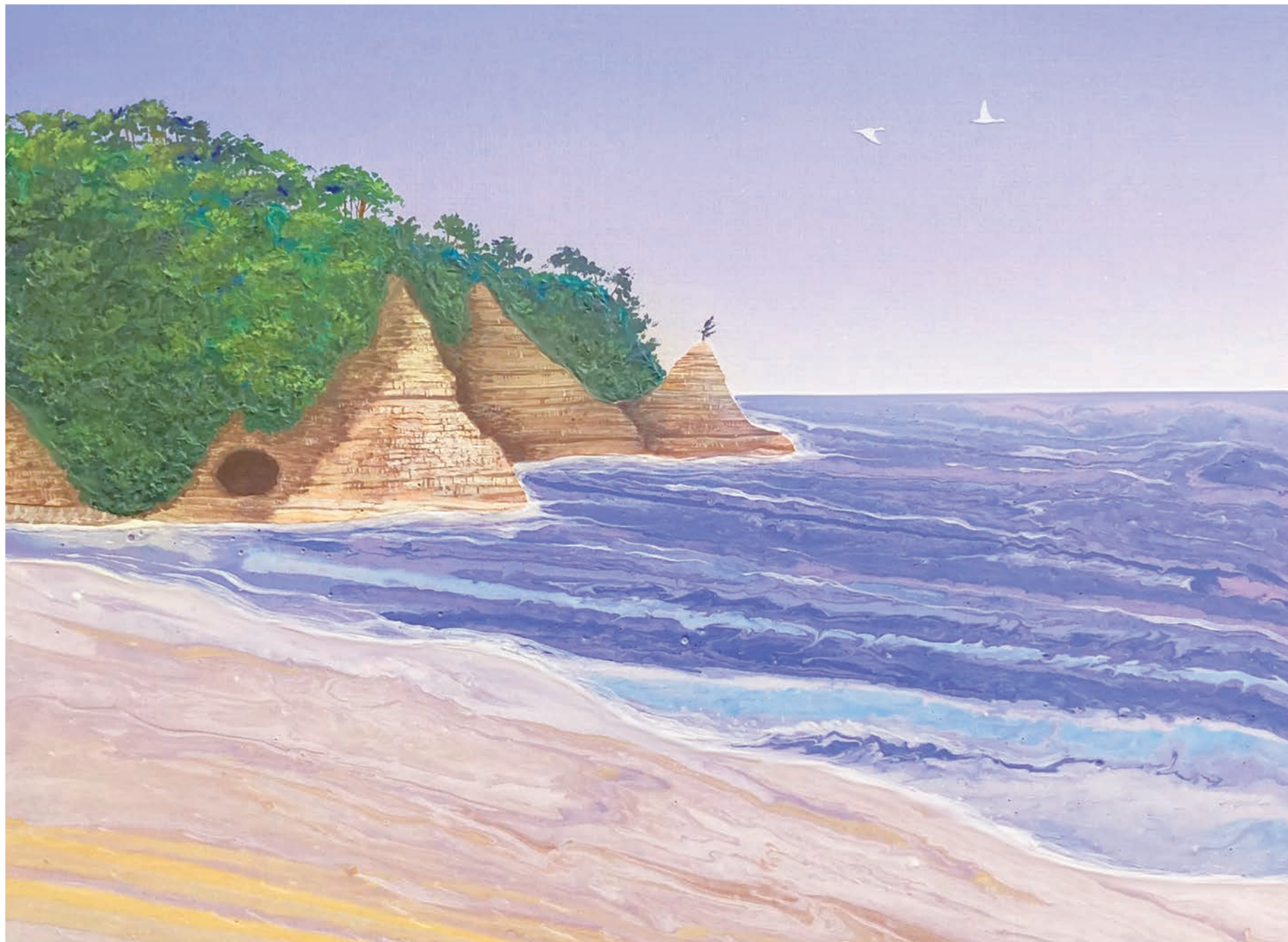
“PEACE-薄磯-” Artist: 金澤裕子 ゆうこけすんのおでかけトーク: 5面をcheck! ◆アーティスト/イラストレーター。いわき市勿来町出身/湯本高校卒業/筑波大学芸術専門学群総合造形専攻卒業