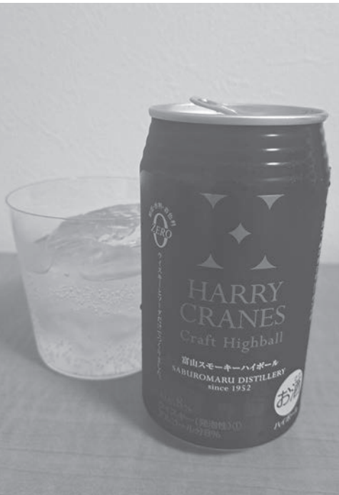
三郎丸蒸留所のハイボール。スモーキーなキレのある本格派

福の時。今回は、そんなハイボールについて、ちょっと深掘りしていきたいと思います。ハイボールはカクテルの名称。日本ではウイスキーのソーダ割り