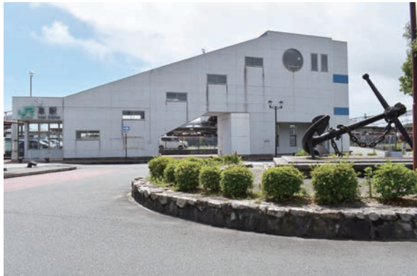
北口広場には、小名浜港の最寄り駅を象徴する「錨（いかり）」のモニュメントが目をはひく。