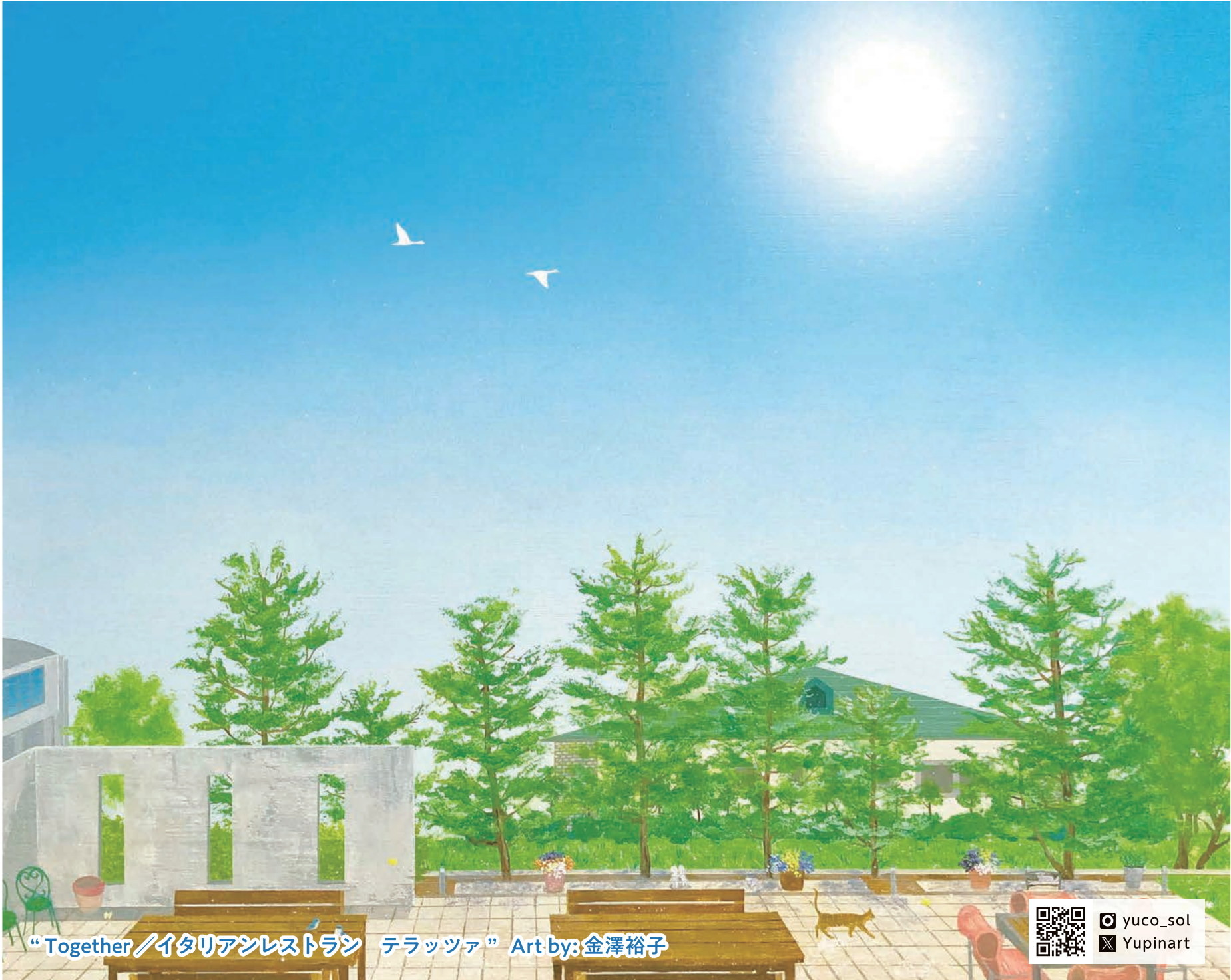
“Together / イタリアンレストラン テラツァ” Art by: 金澤裕子